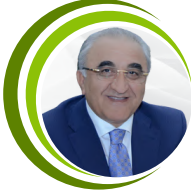
Ədalət Muradov Rector of UNEC UNEC-in rektoru