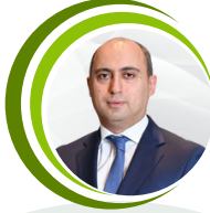
Emin Əmrullayev Minister of Science and Education of the Republic of Azerbaijan Azərbaycan Respublikası Elm və Təhsil naziri